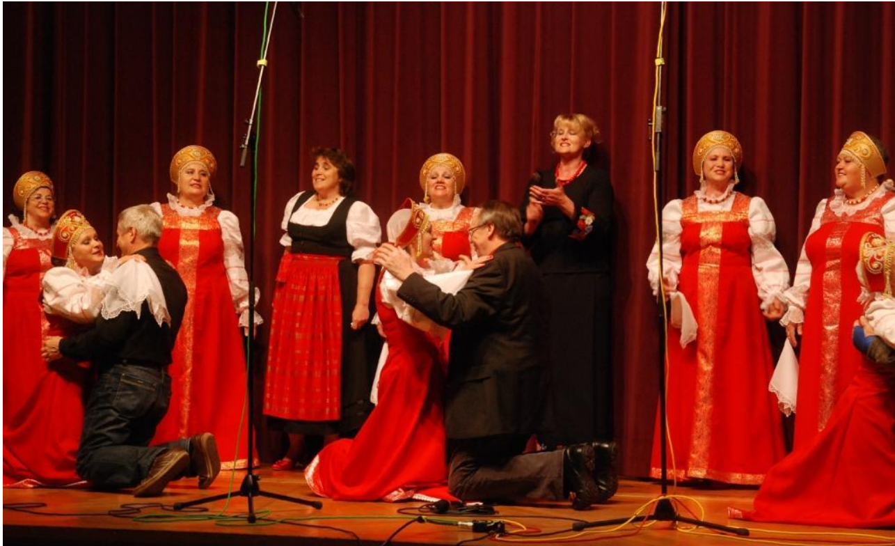
Der Rote Sarafan begeistert bereits seit einigen Jahren das Publikum im Rahmen des Festivals der Vielfalt. Das Bild entstand bei ihrem Auftritt 2012 im Kaufbeurer Stadtsaal. Auch beim diesjährigen Jubiläumsfestival ist die Gesangsgruppe wieder mit dabei. Text und Bild: Marketing-Agentur Claus Tenambergen.