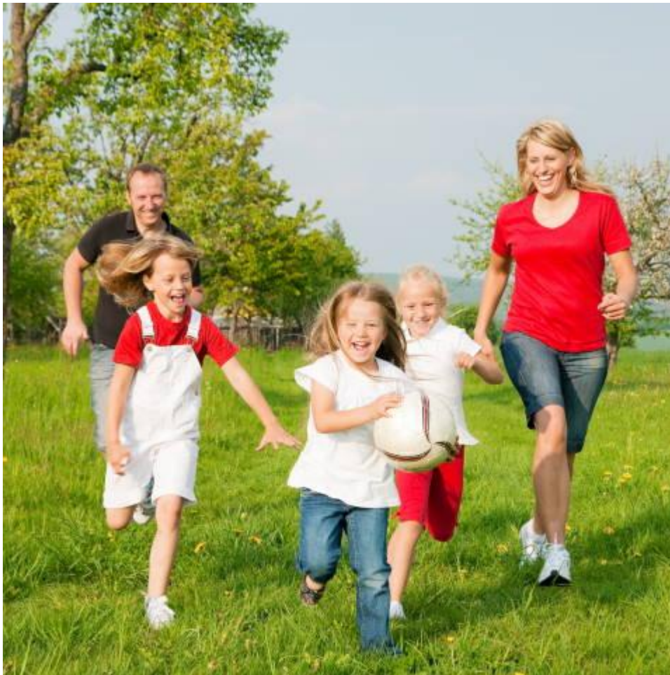
Eine Veranstaltung für die ganze Familie wird die große Auftaktveranstaltung von „Vereint in Bewegung“ im Kaufbeurer Parkstadion mit Spiel, Spaß und Information.

Gefördert im Rahmen des Bundesprogramms „TOLERANZ FÖRDERN - KOMPETENZ STÄRKEN“ des Bundesministeriums für Familie, Senioren, Frauen und Jugend.