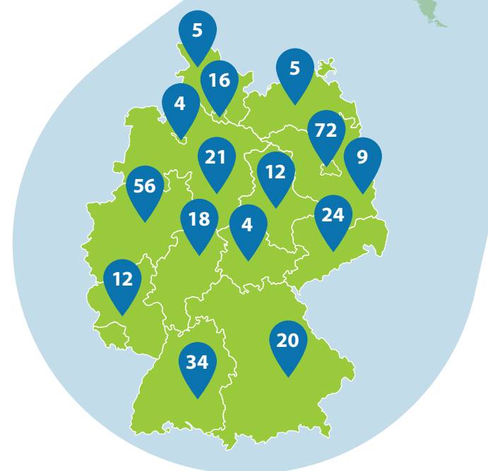
Verteilung der seit 2005 geförderten Ideen für Inlandsprojekte.

In der Civil Academy lernst du, wie du deine Projektidee erfolgreich umsetzen kannst und du wirst Teil eines aktiven Alumni-Netzwerks!